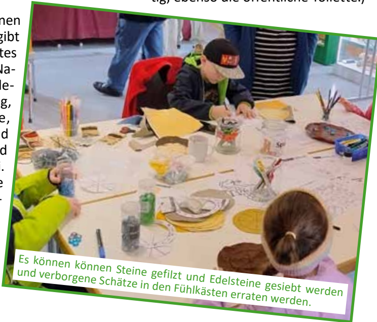
Es können können Steine gefilzt und Edelsteine gesiebt werden und verborgene Schätze in den Fühlkästen erraten werden.

An verschiedenen Infoständen gibt es Wissenswertes zum „Lernort Natur“, zur Igelpflege und -rettung, Schmetterlinge, Mineralien und Gesteinen und zur Falknerei. Auch für die Freunde der Flora wird etwas geboten: am Geopark-Info-stand lädt das Wildblumen-Quiz dazu ein,