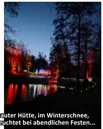
Idyllischer Platz in der Natur: der Striethteich mit neu gebauter Hütte, im Winterschnee, festlich geschmückt für eine Hochzeit, stimmungsvoll beleuchtet bei abendlichen Festen...