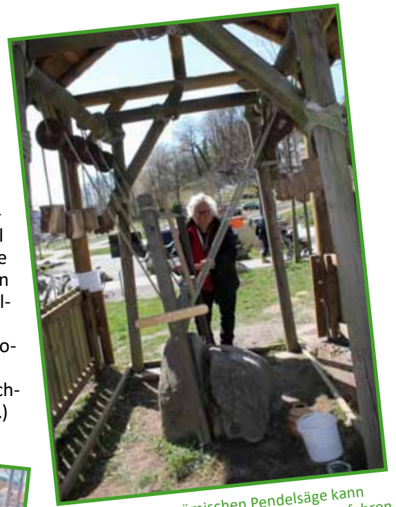
Am Modell einer römischen Pendelsäge kann mit Einsatz der eigenen Muskelkraft erfahren werden, wie die Römer den harten Diorit-Stein zerteilt haben.

Der Familientag und seine Programmpunkte sind kostenfrei! (Nur der Parkplatz ist gebührenpflichtig, ebenso die öffentliche Toilette.)